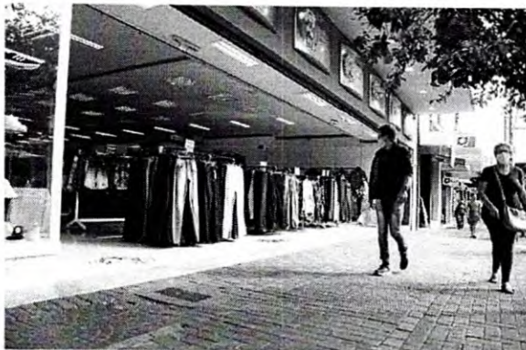
Até segunda-feira o comércio vai seguir o horário atual de funcionamento

creto 7.668/2021 nesta sexta-feira (14), que estende as regras que estão em vigor, atividades comerciais, como bares, restaurantes, shopping centers e comércio em geral, poderão funcionar neste final de semana condicionados a restrições de horário, ocupação, capacidade e modalidade de atendimento. Comércio de rua, shopping centers e museus estão autorizados a abrir ao público das 10h às 22h com limitação de 50% de ocupação – os