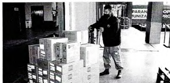
Mais de 170 mil medicamentos de kit de intubação foram encaminhados para regionais

A Secretaria de Estado da Saúde (Sesa) iniciou nesta sexta-feira (14) a distribuição de mais 170.285 medicamentos elencados no chamado “kit de intubação” para pacientes internados com coronavírus. Ao todo 59 hospitais do Plano de Atendimento Covid-19 nas 22 Regionais de Saúde irão receber os medicamentos.