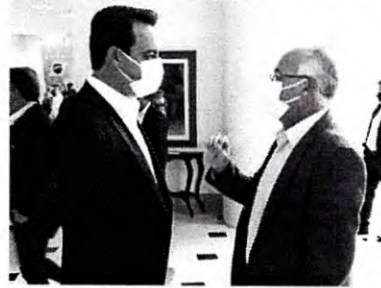
Governador Ratinho Junior com o vereador Poim, presidente da Câmara

O presidente da Câmara de Apucarana, vereador Francielei Preto Godoi Poim (PSD), voltou de Curitiba nesta sexta-feira com um saldo positivo da viagem que fez durante a semana para a Capital do Estado. Destaque para a liberação, feita pelo governador Ratinho Júnior (PSD), das 42 casas para o Distrito de Caixa de São Pedro.